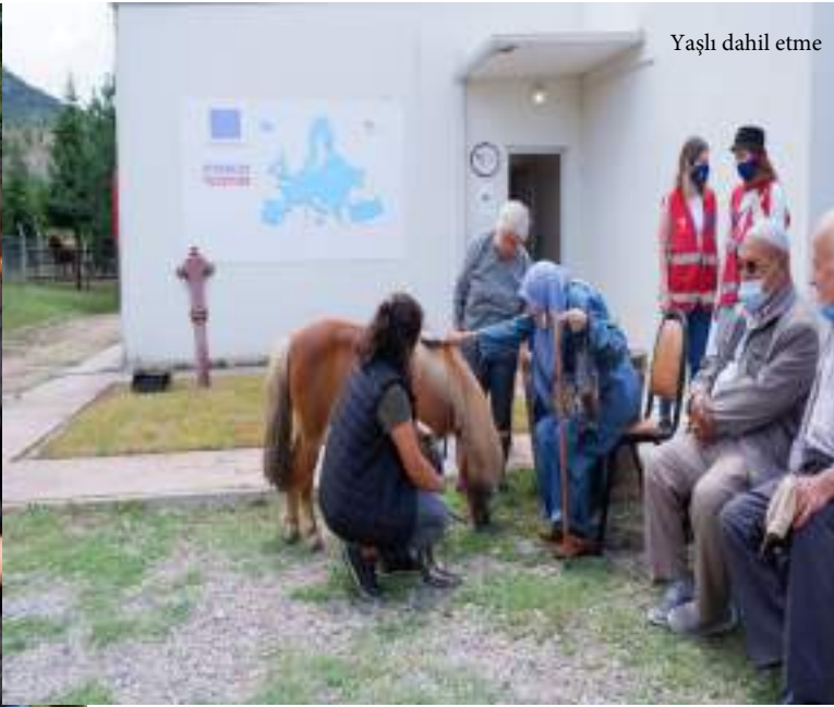
Yaşlı dahil etme