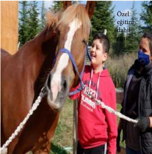
Özel eğitim dahil etme