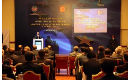
M. Kemal Atatürk Konferans Salonu, Elazığ

Belediyelerimizin AB ile ilgili konularda idari kapasitelerinin güçlendirilmesi için Avrupa Birliği Genel Sekreterliği ile Türkiye Belediyeler Birliği işbirliğinde yürütülen “Belediyeler AB'ye Hazırlanıyor Projesi”nin bölgesel bilgilendirme toplantısı, Devlet Bakanı ve Başmüzakereci Egemen Bağış ve Elazığ Valisi Muammer Erol'un katılımlarıyla 9 Mart 2011 tarihinde Elazığ'da yapıldı.