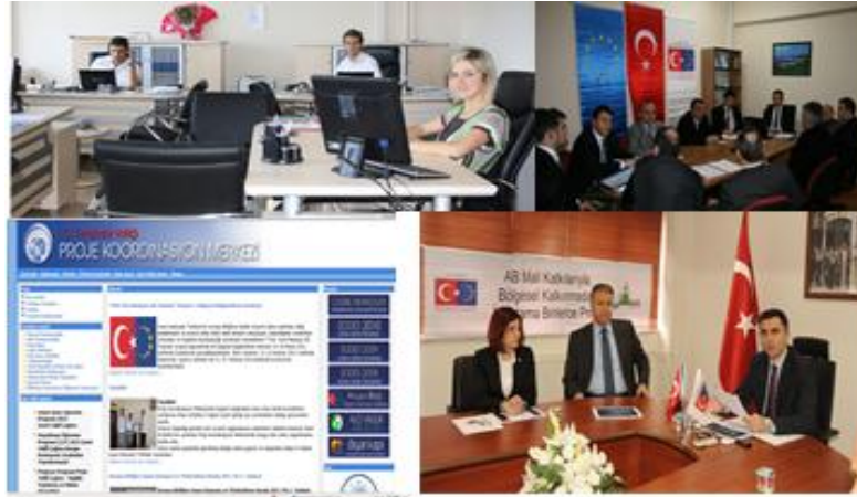
Bitlis, Artvin ve Giresun valilik AB birimlerinden görüntüler Diyarbakır Valiliği Proje Koordinasyon Merkezi internet sayfası

"Valiliklerin AB Sürecinde Etkinliğinin Artırılması Projesi" 2010 yılında, Avrupa Birliği Bakanlığı tarafından İçişleri Bakanlığı ile işbirliği içerisinde, yerelde AB müzakere sürecine ilişkin motivasyonu artırmak amacıyla geliştirilmiştir.