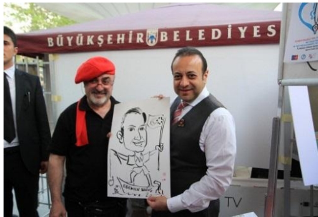
Ankara AB Projeleri Fuarı, 9 Mayıs 2012