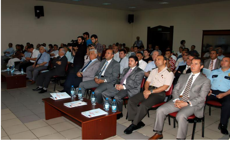
Muğla AB Yolunda Elele Projesi Açılış Töreni, 29 Haziran 2012, Muğla

“Avrupa Birliği Faaliyetlerine Destek” bileşeni teklif çağrısı duyurusuna 25 Ocak 2012 tarihinde çıkmış; 12 Nisan 2012 tarihinde destek almaya hak kazanan 12 proje kamuoyuna duyurulmuştur.