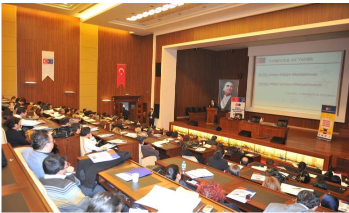
Hayatboyu Öğrenme Programı Bilgi Günü - 11 Aralık 2012

Eğitim faaliyetleri “İPA Kapsamındaki AB Hibe Programları” ve “Bilgi Toplumu Teknolojileri Politikası Destek Programı” eğitimleri ile devam edecektir.