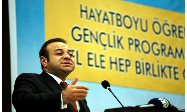
Hayatboyu Öğrenme ve Gençlik Programları için El Ele Hep Birlikte Geleceğe Projesi Açılış Toplantısı, 30 Kasım 2012, Malatya

30 Kasım 2012 tarihinde Avrupa Birliği Bakanı ve Başmüzakereci Sayın Egemen BAĞIŞ'ın katılımlarıyla açılış töreni yapılan Hayatboyu Öğrenme ve Gençlik Programları için El Ele Hep Birlikte Geleceğe Projesi kapsamında bölgesel proje fuarı, çalıştaylar, çalışma ziyaretleri ve gençlik faaliyetleri gerçekleştirilecektir.