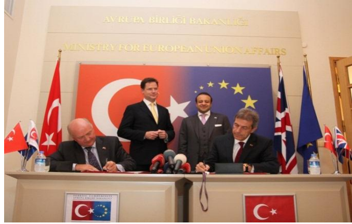
Protokol İmza Töreni, 4 Ekim 2012, Avrupa Birliği Bakanlığı İstanbul Ortaköy Ofisi

4 Ekim 2012 tarihinde düzenlenen protokol imza töreni ile hayata geçirilen proje; Avrupa Birliği Bakanlığı, Adalet Bakanlığı ve Türkiye Barolar Birliği'nin işbirliği ile yürütülmektedir.