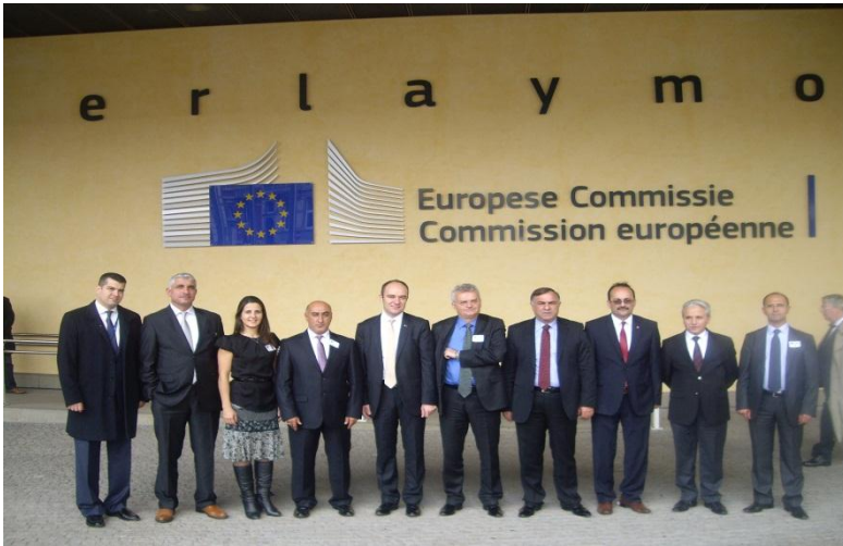
16-19 Ekim 2012 Tarihinde Gerçekleştirilen Brüksel Çalışma Ziyareti

Vilayetler Hizmet Birliği Encümen üyelerine yönelik olarak, 21-23 Mayıs 2012 ve 16-19 Ekim 2012 tarihlerinde Brüksel çalışma ziyaretleri düzenlenmiştir.