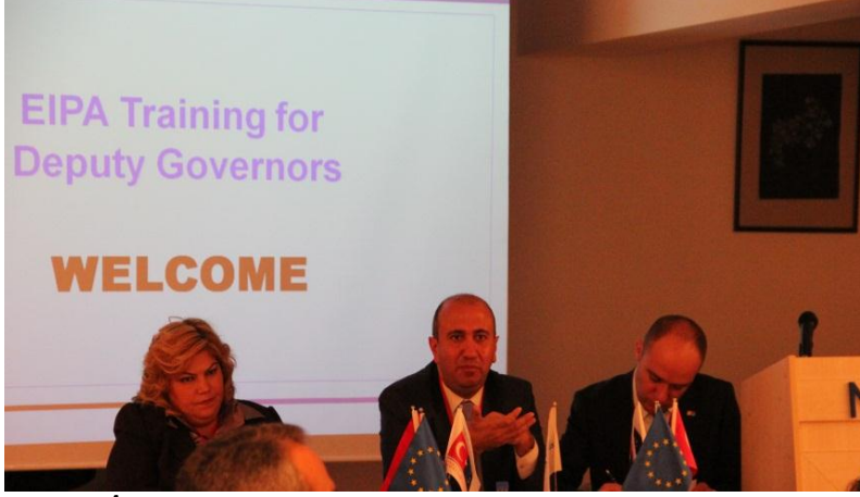
81 "İl AB Daimi Temas Noktası" vali yardımcısına yönelik "AB Kurumları ve Mekanizmaları Eğitimi" – Maastricht