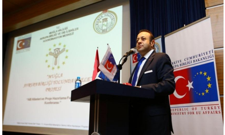
Muğla Valiliği Avrupa Birliğine Uyum Danışma ve Yönlendirme Kurulu Toplantısı – 26 Aralık 2012