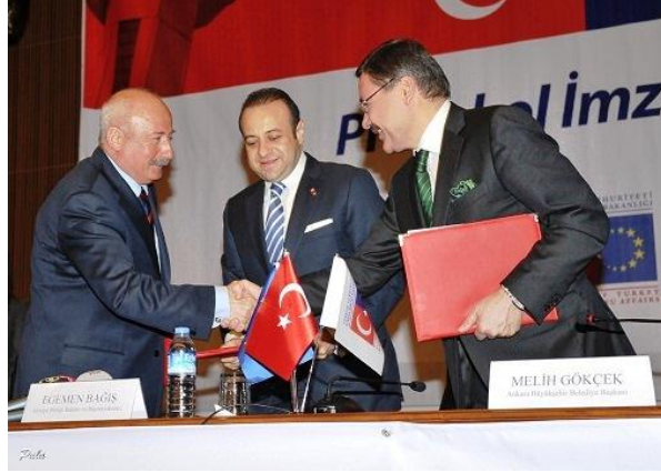
Protokol İmza Töreni, 27 Mart 2012

Avrupa Birliği Bakanlığı, Ankara Valiliği ve Ankara Büyükşehir Belediyesi'nin birlikte geliştirdiği "Ankara AB'ye Hazırlanıyor Projesi" için ilk imzalar 27 Mart 2012 tarihinde, Avrupa Birliği Bakanı ve Başmüzakereci Sayın Egemen Bağış, Ankara Valisi Sayın Alaaddin Yüksel ve Ankara Büyükşehir Belediye Başkanı Sayın Melih Gökçek'in katılımlarıyla gerçekleşen protokol imza töreni ile atılmıştır.