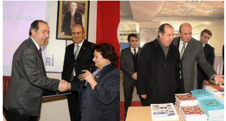
Avukatlar için Yargı ve Temel Haklar Projesi Eğitimi, Erzurum 10 Ocak 2013

Avrupa Birliği Katılım Müzakereleri fasıl başlıklarından "Yargı ve Temel Haklar" konusunda belirlenen yedi pilot ilde (Erzurum, Hatay, Konya, Kastamonu, Manisa, Şanlıurfa, Siirt) toplam 350 avukata yönelik eğitimler ve çalıştaylar düzenlenecektir.