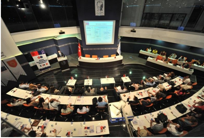
7. Çerçeve Programı Bilgi Günü - 3 Temmuz 2012

Proje kapsamında 12-13 Haziran 2012 tarihlerinde “Kültür Programı”, 29 Haziran 2012 tarihinde “Girişimcilik ve Yenilik-Eko-İnovasyon Programı”, 3 Temmuz 2012 tarihinde “7. Çerçeve Programı” ve 11 Aralık 2012 tarihinde “Hayatboyu Öğrenme ve Gençlik Programları” eğitimleri düzenlenmiştir.