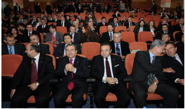
Avrupa Birliği Bakanı ve Başmüzakereci Sayın Egemen BAĞIŞ ve İçişleri Bakanı Sayın Muammer GÜLER

Valiliklerimizin iletişim faaliyetlerinde kullanılmak üzere 5000'den fazla kitap , 10.000'den fazla afiş ve 100.000'den fazla broşür basılmıştır.