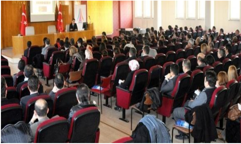
Isparta Kapıyı Aralarken Projesi Eğitim Programı, 5 Aralık 2012, Isparta

“Avrupa Birliği Faaliyetlerine Destek” bileşeni kapsamında desteklenen projeler ile valiliklerdeki AB birimlerinin altyapısının güçlendirilmesi amaçlanmaktadır.