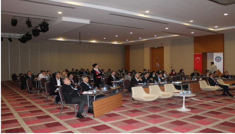
18-21 Ocak 2012 Tarihinde Gerçekleştirilen Hayatboyu Öğrenme ve Gençlik Programları Eğitimleri

Proje kapsamında 18-21 Ocak 2012 ve 12-16 Kasım 2012 tarihlerinde İl Özel İdareleri ve Valilik AB birimleri çalışanlarına yönelik “Hayatboyu Öğrenme ve Gençlik Programları Eğitimleri” düzenlenmiştir.