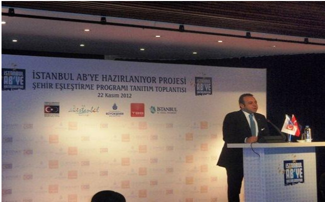
Şehir Eşleştirme Programı Tanıtım Toplantısı, 22 Kasım 2012