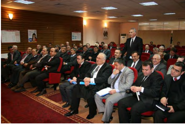
AKSARAY AB UDYK 1.TOPLANTISI 26.01.2012