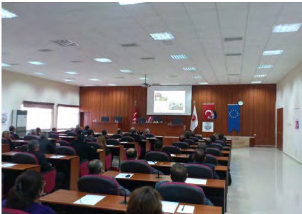
AYDIN 2012 YILI 3.UDYK TOPLANTISI 26.12.2012