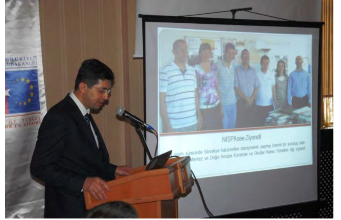
AFYONKARAHİSAR AB UDYK 1. TOPLANTISI 07.06.2012