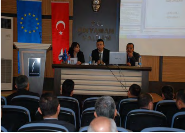
ADIYAMAN AB UDYK 1.TOPLANTISI 18.01.2012