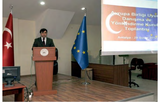
ANTALYA AB UDYK 1.TOPLANTISI 29.02.2012