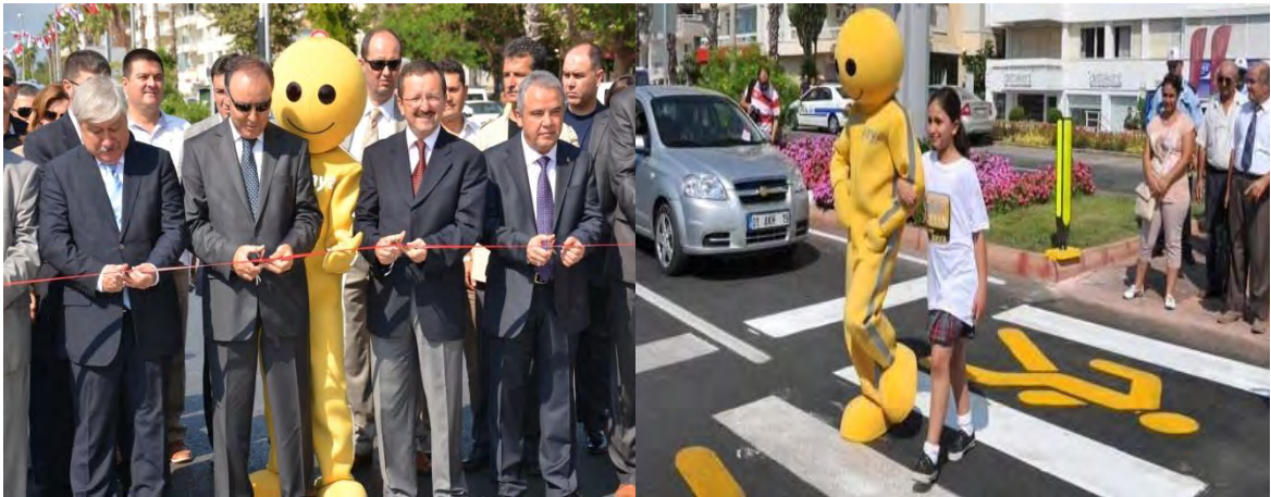
Antalya'da Yaya Önceliği ve Güvenliğini Sağlamak için Hayatboyu Öğrenme Projesi

Hayatboyu Öğrenme Programı Leonardo da Vinci Yenilik Transferi kapsamında finanse edilen proje ile yaya önceliğini ve güvenliğini yenilikçi bir yaklaşımla toplumun benimsemesini sağlamak, yeni bir öğrenme modülü ve pilot uygulamalar ile sürücü eğitimlerini, öğretmenleri ve trafik polislerini eğiterek mesleki gelişimlerine katkıda bulunmak, yayalara trafik kültürünü, şoförlere yaya kültürünü öğretmek amaçlanmıştır. 2 yıl süreyle uygulanan projenin bütçesi 365.073 Avro'dur.