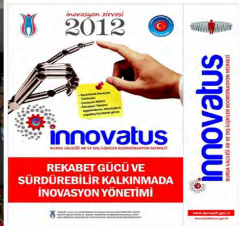
Rekabet Gücü ve Sürdürülebilir Kalkınmada İnovasyon Yönetimi Projesi