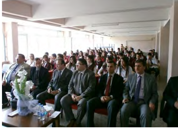
9 Mayıs Etkinlikleri