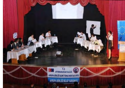
AB Bilgi Yarışması