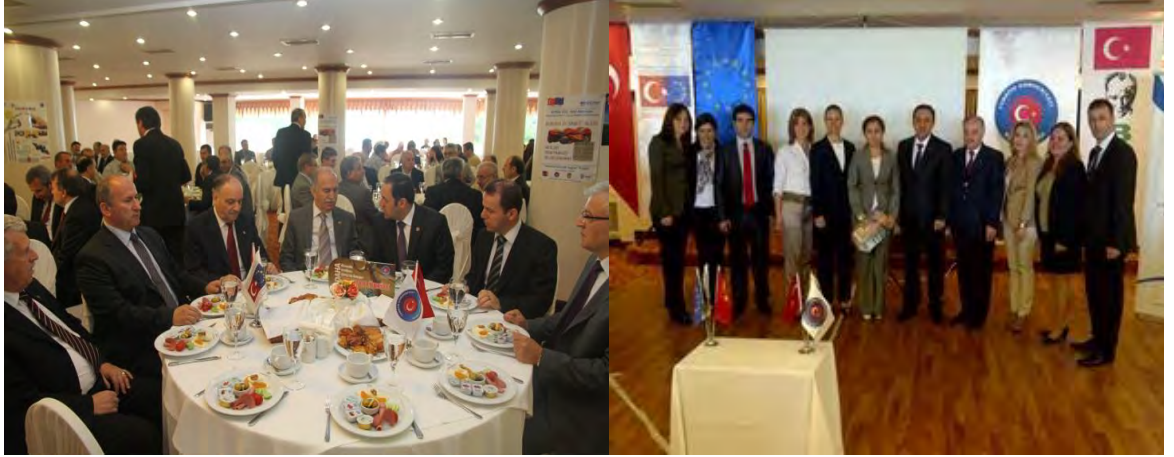
9 Mayıs Avrupa Günü Çalışma Kahvaltısı

Bursa Valiliđi AB ve Dış İliřkiler Koordinasyon Merkezi tarafından Türkiye'nin Avrupa Birliđi üyelik sürecinin doğru algılanması, toplumun her kesiminde farkındalık yaratılması ve Avrupa Birliđi hibelerinden daha fazla faydalanılması konularında görüş alışverişinde bulunulması amacıyla 9 Mayıs Avrupa Gününde çalışma kahvaltısı yapılmıştır.