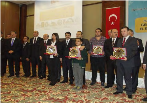
MALATYA AB UDYK 2.TOPLANTISI