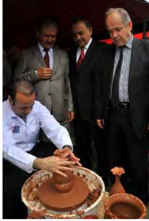
Avrupa Birliđi Bakanı ve Bařmüzakereci Egemen Bađıř'ın Nevřehir Valiliđi standını ziyareti