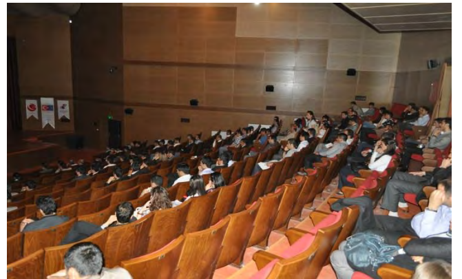
BATMAN 2012 YILI 1.UDYK TOPLANTISI