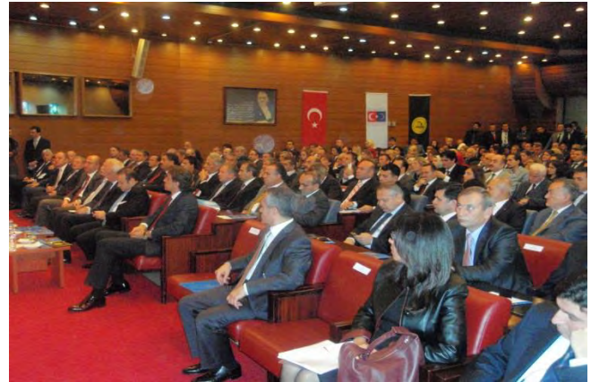
İSTANBUL AB UDYK 1.TOPLANTISI