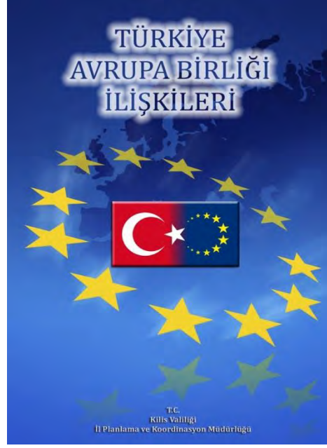
“Avrupa Birliği ve Politikaları” ve “Türkiye Avrupa Birliği İlişkileri” isimli kitaplar