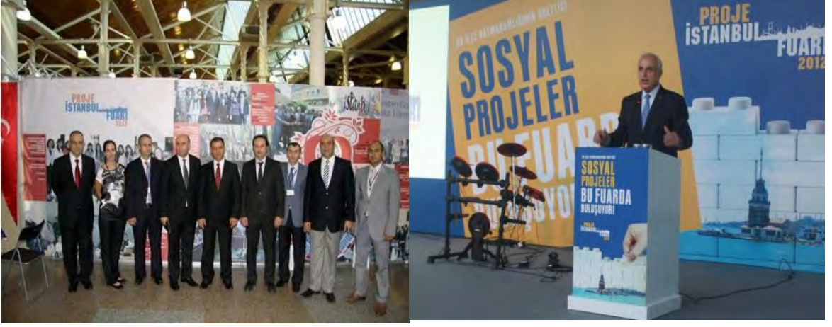
Proje İstanbul Fuarı

İstanbul'daki 39 kaymakamlığın Avrupa Birliği fonları aracılığıyla uyguladıkları projelerin tanıtıldığı fuar 17-19 Ekim tarihleri arasında Feshane Uluslararası Fuar Kongre ve Kültür Merkezi'nde gerçekleştirilmiştir. Fuarda 352'si kaymakamlıklara, geri kalanı diğer kurum ve kuruluşlara ait 399 proje sergilenmiştir. Bunun yanı sıra, Avrupa Birliği Bakanlığı tarafından desteklenen ve İstanbul Valiliği Dış İlişkiler ve AB Koordinasyon Merkezi koordinasyonunda başlatılan “İstanbul AB'ye Hazırlanıyor” projesinin önemli faaliyetlerinden biri olan “Yerel Yönetimler Geliştirme ve İstatistik Web Portalı”nın tanıtım sunumu gerçekleştirilmiştir.