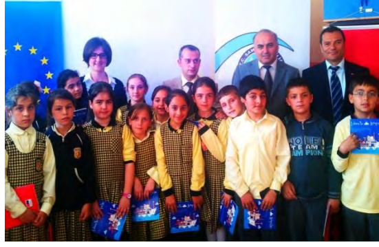
Arıburnu İ.Ö.O. öğrencileri ile 9 Mayıs Avrupa Günü