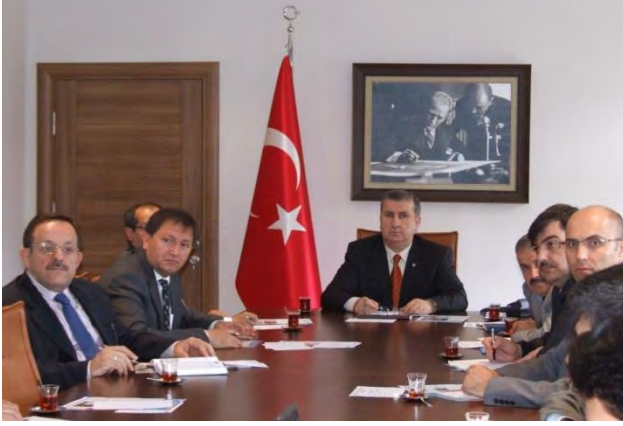
ÇORUM AB UDYK 1.TOPLANTISI