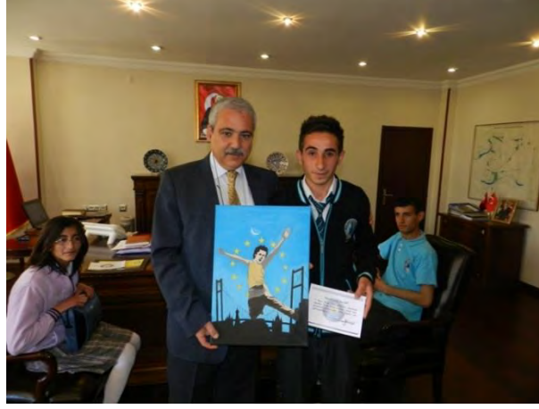
Avrupa Birliđi ve Gençlik konulu resim yarışması