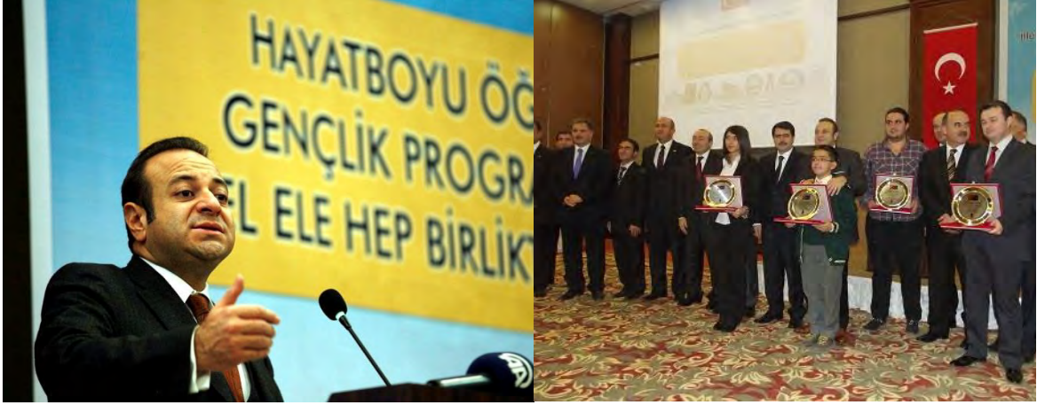
Hayatboyu Öğrenme ve Gençlik Programları için El Ele Hep Birlikte Geleceğe Projesi Açılış Töreni

Avrupa Birliği Bakanlığı tarafından desteklenen İllerimiz AB'ye Hazırlanıyor Projesi II-Bölgesel Projelere Destek Bileşeni kapsamında desteklenen proje Malatya ilinin koordinatörlüğünde ve Adıyaman, Elazığ, Bingöl, Tunceli illerinin işbirliğinde yürütülmektedir. 30 Kasım 2012 tarihinde Avrupa Birliği Bakanı ve Başmüzakereci Sayın Egemen BAĞIŞ'ın katılımlarıyla açılış töreni yapılan projenin toplam bütçesi 228 bin TL'dir. “Hayatboyu Öğrenme ve Gençlik Programları için El Ele Hep Birlikte Geleceğe Projesi” kapsamında bölgesel proje fuarı, çalıştaylar, çalışma ziyaretleri ve gençlik faaliyetleri gerçekleştirilecektir.