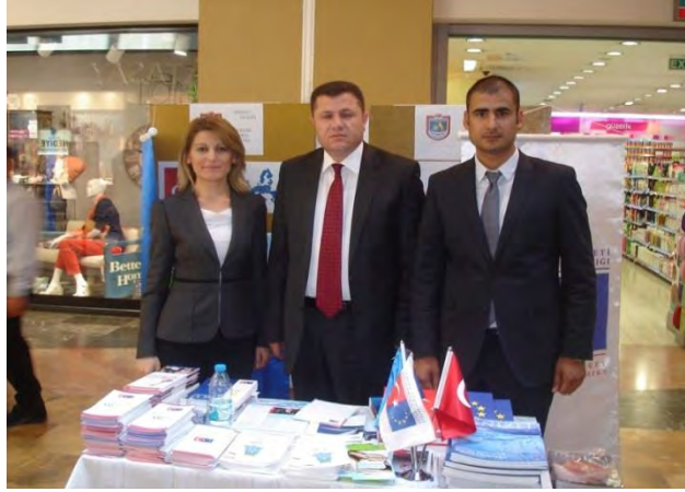
9 Mayıs Avrupa Günü Etkinlikleri

9 Mayıs Avrupa Günü etkinlikleri kapsamında 8-10 Mayıs 2012 tarihleri arasında, kent merkezinde stant açılarak halka AB ile ilgili bilgilendirme broşürleri dağıtılmıştır.