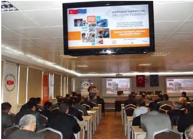
Proje Yazma Eğitimi Malatya, 26-27 Kasım 2012