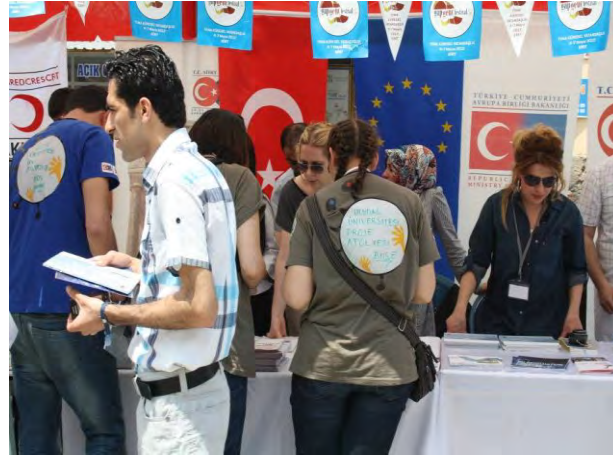
GAP Genç Festivalinde Kurulan AB Standı ve Bilgilendirme Faaliyetleri

2012 yılında Siirt'te gerçekleştirilen uluslararası nitelikli GAP Genç Festivali kapsamında Siirt Valiliği AB ve Dış İlişkiler Koordinasyon birimi stant açarak festival süresince Avrupa Birliği hakkında çeşitli dokümanlar dağıtmıştır. Bunun yanında Siirt AB ve Dış İlişkiler Koordinasyon Merkezi tarafından yürütülen ve yürütülmesi planlanan projeler hakkında da bilgilendirme yapılmıştır. Festivale Avrupa Birliği Bakanı ve Başmüzakereci Egemen BAĞIŞ ile Kalkınma Bakanı Cevdet YILMAZ başta olmak üzere çok sayıda üst düzey katılım olmuştur.