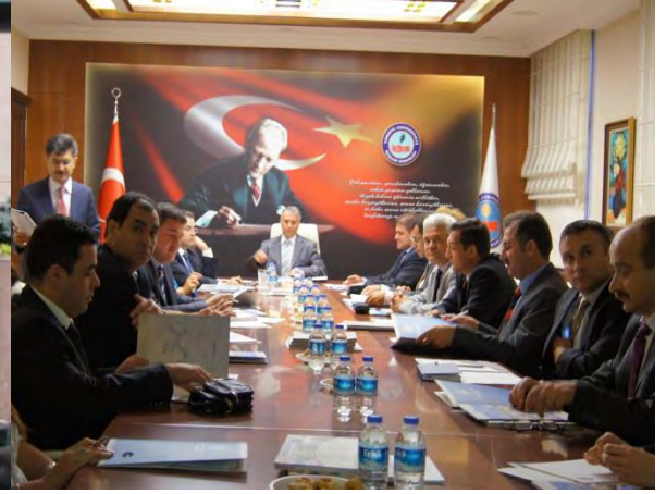
İçişleri Bakanlığı Çalışma Ziyareti