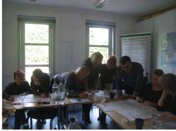
Dil ve Kültürlerarası Beceriler Projesi

öğrenme) bir yaygın eğitim programı geliştirmektedir. 2 yıl süreyle yaklaşık 400 bin Avro'luk bütçe ile uygulanacak projede Avusturya, Almanya, İtalya, İngiltere, Romanya'dan ortak kurumlar bulunmaktadır.