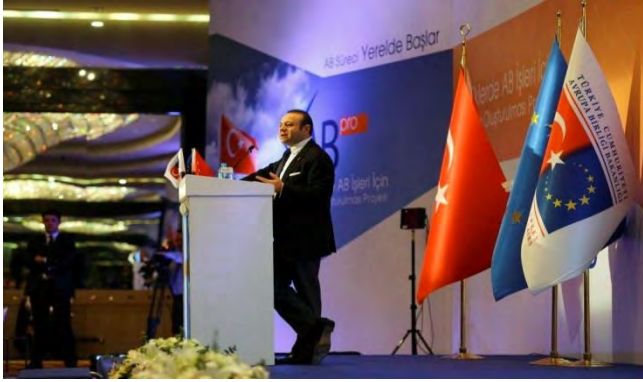
Valiliklerde AB İşleri İçin Kapasite Oluşturulması Projesi Açılış Konferansı, Ankara, 19 Mart 2013

Yereldeki yapılanma ve farklı aktörlerle işbirliği içerisinde yürütülen çalışmalar, ilerleme raporlarında da takdirle karşılanmıştır. Avrupa Komisyonu, Katılım Öncesi AB Mali Yardımı (IPA) altında yer alan SEI – Avrupa Entegrasyon Sürecine Destek Programı (Support Activities to Strengthen the European Integration Process) kapsamında 2012 yılının Aralık ayında uygulamaya konan “Valiliklerde AB İşleri İçin Kapasite Oluşturulması Projesi”ne yaklaşık 1.950.000 Avro’luk bir finansal destek sağlamıştır. Söz konusu proje ile yerelde sürdürülen çalışmalara destek vermeye devam edilecektir.