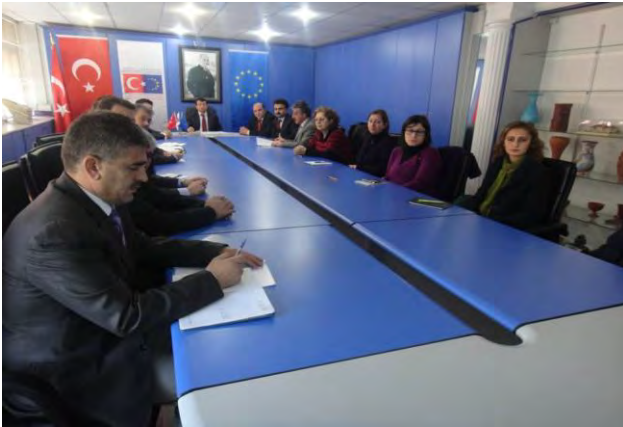
GÜMÜŞHANE 2012 YILI 4.UDYK TOPLANTISI