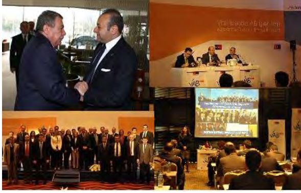
Valiliklerde AB İşleri İçin Kapasite Oluşturulması Projesi