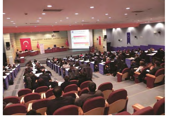
AB ve Diğer Fonlar Eğitimi, Ankara, 16 Şubat 2012