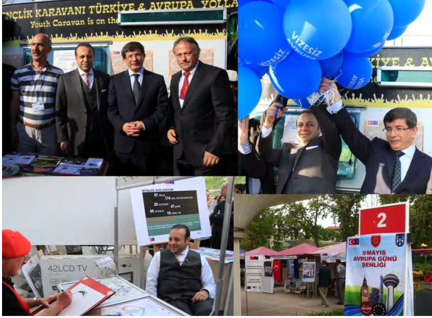
9 Mayıs Avrupa Günü Etkinlikleri

25 valilik AB birimi tarafından kurulan stantlarda yerel ürünler ve projeler tanıtılmıştır.