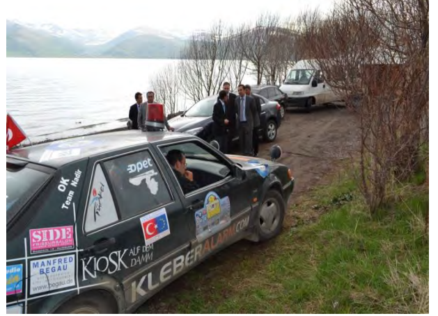
9 Mayıs Avrupa Günü Klasik Otomobil Rallisi