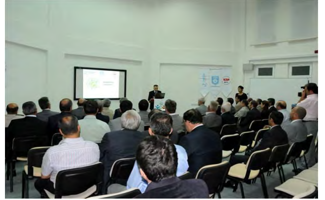
KARAMAN 2012 YILI 1.UDYK TOPLANTISI