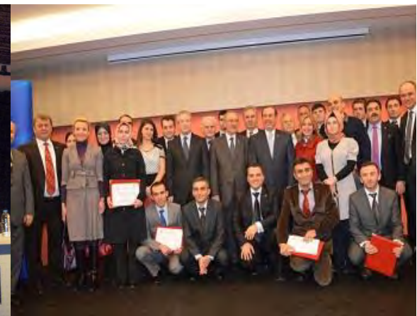
Eğitim Sertifika Töreni