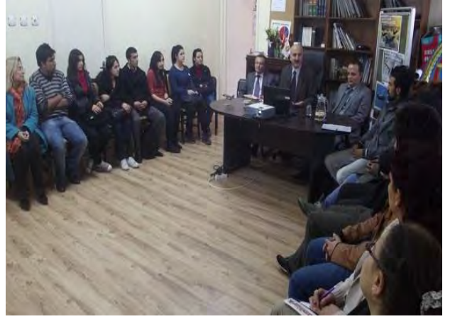
Hayatboyu Öğrenme ve Gençlik Programı Bilgilendirme Toplantısı Konya, 20 Mayıs 2012