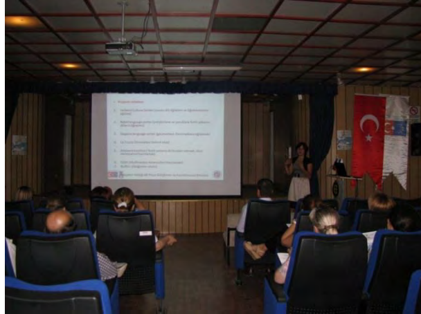
Kültürleri Dinleme Projesi

Eskişehir Valiliği AB Proje Geliştirme ve Koordinasyon Merkezi tarafından Hayatboyu Öğrenme/Grundtvig Öğrenme Ortaklıkları kapsamında uygulanan “ Kültürleri Dinleme ” projesinin yaygınlaştırma toplantısı 27 Haziran 2012 tarihinde gerçekleştirilmiştir. Danimarka, Estonya, İtalya, Romanya, Yunanistan ortaklığında uygulanan 2 yıl süreli proje kapsamında, yabancı dil öğretmenlerinin derslerinde bilgi ve iletişim teknolojilerinin daha etkin kullanılması hedeflenmiştir.