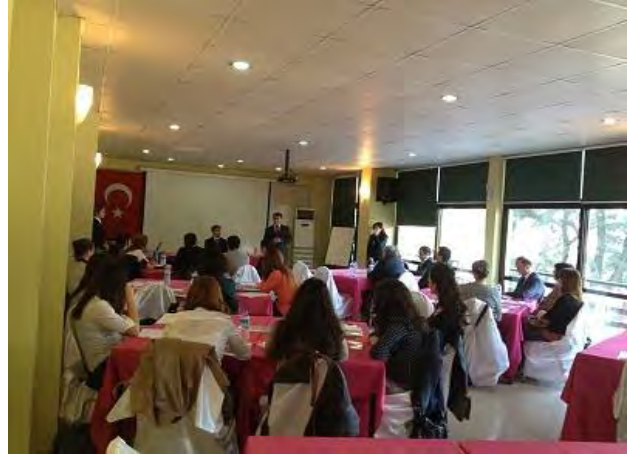
Proje Hazırlama Eğitimi İzmir, 29-30 Mart 2012