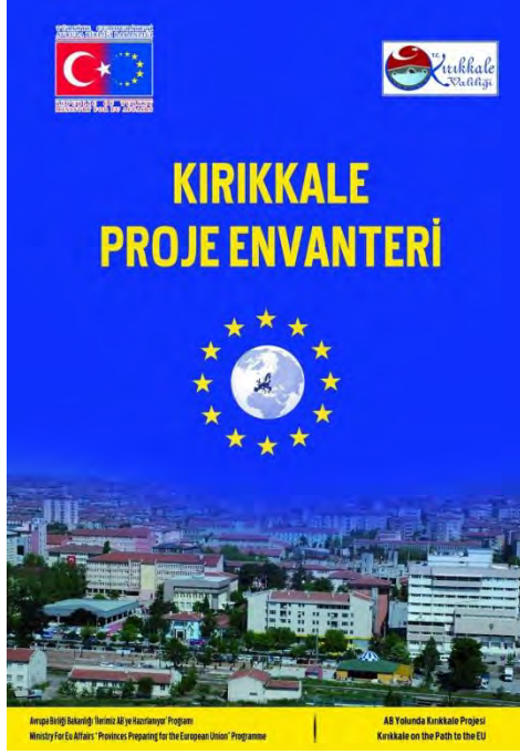
Kırıkkale Proje Envanteri Kitabı

2004-2011 yılları arasında Avrupa Birliği fonları ve Kalkınma Ajansı kaynakları tarafından desteklenen ve Kırıkkale'de uygulanan 59 adet proje “ Kırıkkale Proje Envanteri Kitabı ” adı altında bir araya getirilerek basımı ve çoğaltımı yapılmıştır. Söz konusu yayının ilgili bakanlıklar ve merkez birimleri, valilikler, belediyeler ve ildeki kurum ve kuruluşlara yaygın bir şekilde dağıtımı yapılmıştır. Kitapta yer verilen projelerin yürütülmesinde 2.613.000 Avro AB kaynağı ve 2.100.000 TL yerel kaynak kullanılmıştır.