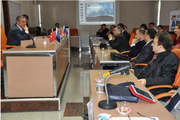
ÇANAKKALE 2012 YILI 2.UDYK TOPLANTISI