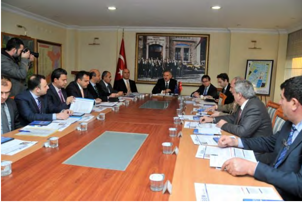
EDİRNE AB UDYK 1.TOPLANTISI