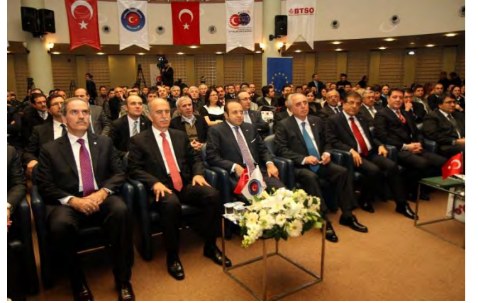
BURSA AB UDYK 1.TOPLANTISI