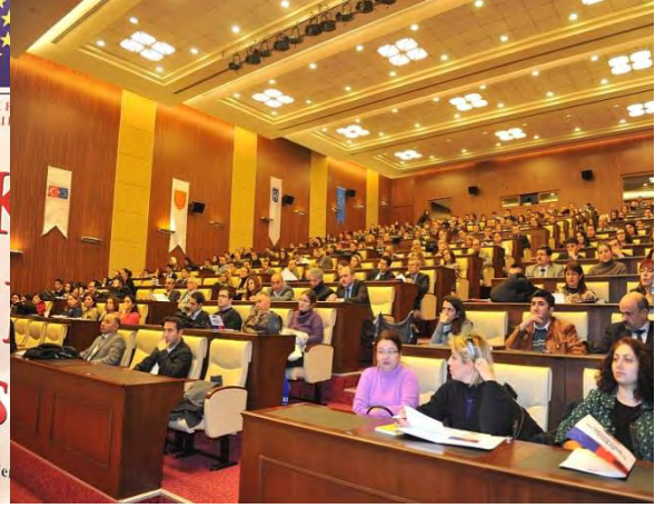
Proje kapsamında düzenlenen eğitimler