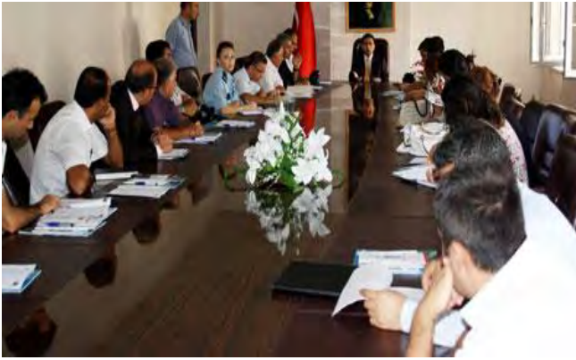
ŞİİRT AB UDYK 2.TOPLANTISI