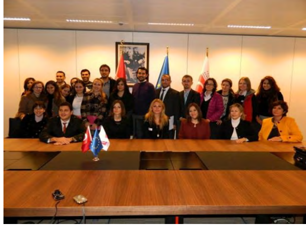
“İzmir ‘de AB Rüzgarı” Projesi Brüksel Çalışma Ziyareti