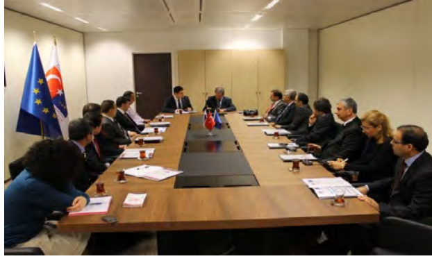
Brüksel çalışma ziyareti