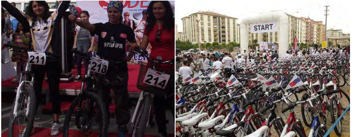
9 Mayıs Avrupa Günü Bisiklet Yarışı

9 Mayıs etkinlikleri çerçevesinde Avrupa Birliği'ne ve Türkiye'nin AB sürecine dikkat çekilmesi ve toplumda "Avrupalılık" bilincinin güçlendirilmesi amaçlarıyla "Avrupa Günü'nde Bisiklet Yarışı" etkinliği gerçekleştirilmiştir. Bisiklet yarışına 500'ü aşkın vatandaşımız katılmıştır.