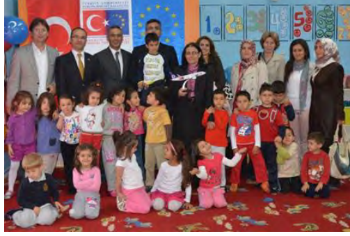
Okullarda Gerekleřtirilen Etkinlikler

Avrupa Birliđi Bakanlıđı tarafından yrtlen İllerimiz AB'ye Hazırlanıyor II-AB Faaliyetlerine Destek Bileşeni altında desteklenen “Kapıları Aralarken Projesi” kapsamında Isparta Valiliđi Projeler Koordinasyon Merkezi tarafından ana sınıftan lise dzeyine kadar okullarda AB ile ilgili etkinlikler, billboard tanıtımları, “AB Bilgi Yarışması” ve “AB Konseri” gerekleřtirilmiřtir. Ayrıca, “Isparta Avrupa Birliđi alıřmaları” adı altında yayınlanan derginin iki sayısı basılmıřtır.