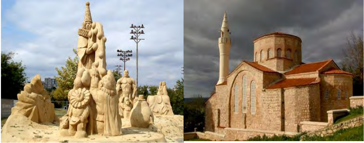
Sınırötesi Mirasların Tanıtımı için Yeni Bir Başlangıç Projesi