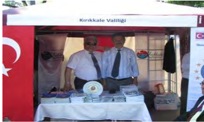
9 Mayıs Etkinlikleri

Ankara Gençlik Parkı'nda düzenlenen etkinliğe Valilik AB birimi personeli ile Kırıkkale Kültür ve Turizm Müdürlüğü Ustalar Müzik ve Oyun Topluluğu sanatçılarından oluşan 8 kişilik bir ekip ile katılım sağlanmıştır.