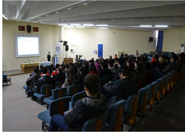
9 Mayıs Avrupa Günü

9 Mayıs Avrupa Günü kapsamında Fırat Üniversitesi'nde, Türkiye-AB ilişkilerinde yaşanan son gelişmelerin değerlendirildiği ve Elazığ Valiliği AB Dış İlişkiler ve Projeler Koordinasyon Merkezi personeli ile üniversite öğrencilerinin katılım sağladığı bir konferans düzenlenmiştir.