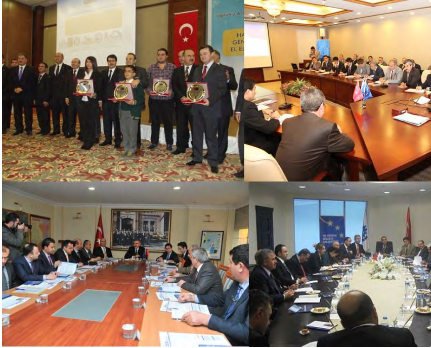
İllerimizde Gerçekleştirilen AB UDYK Toplantıları

Yukarıda adı geçen projelerin etkin ve verimli bir şekilde sürdürülmesine destek olmak amacıyla 2012 yılında da illerimizde İl AB Daimi Temas Noktaları ve valilik AB ofisleri çalışmalarına devam etmiş, UDYK toplantıları gerçekleştirilmiş, eğitim, seminer ve çalıştaylar düzenlenmiştir. Avrupa Birliği Bakanlığı internet sitesinde yer alan “AB Süreci ve İllerimiz” portalında her ilimize yönelik oluşturulan sayfalarda illerimizde gerçekleştirilen projelere ve faaliyetlere ilişkin bilgilere yer verilmiştir. Portalda ayrıca; İl AB Daimi Temas Noktası vali yardımcıları, AB UDYK ve valilik AB birimleri, AB Bilgi Merkezleri, Kalkınma Ajansları ve Eurodesk Temas Noktalarının iletişim bilgileri, AB hibe duyuruları ve hibe duyurularına ilişkin başvuru şekli gibi illerimiz için önemli bilgiler yer almaktadır. Vatandaşlarımız valilik AB birimlerinin internet siteleri üzerinden de AB konularında bilgilenmeye devam etmektedir.