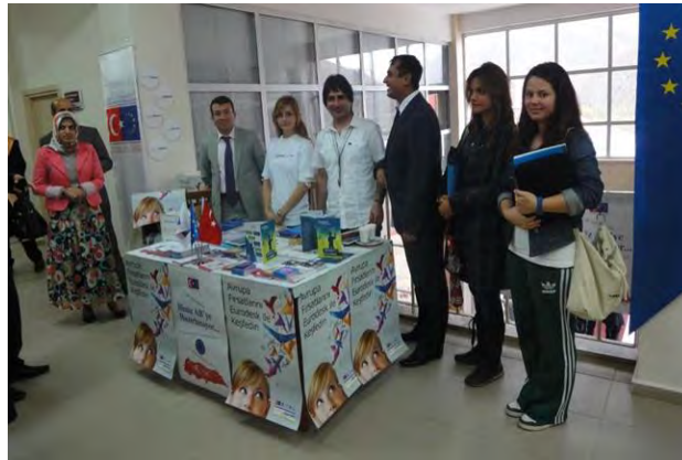
İlimiz AB Yolunda Projesi Tanıtım Etkinlikleri

AB konusunda Gümüşhane Valiliği'nin kurumsal kapasitesinin ve il düzeyindeki farkındalık seviyesinin artırılmasını hedefleyen, Avrupa Birliği Bakanlığı'nın İllerimiz AB'ye Hazırlanıyor-II programı kapsamında desteklenen “ İlimiz AB Yolunda ” projesi, 2012 yılı boyunca Gümüşhane ilinde pek çok faaliyet gerçekleştirilmesine imkan tanımıştır. Proje kapsamında; “Eğiticilerin Eğitimi” ve “Proje Döngüsü Yönetimi” eğitim programları, Brüksel çalışma ziyareti gibi çeşitli etkinlikler gerçekleştirilmiştir. 9 Mayıs Avrupa Günü etkinlikleri kapsamında resim ve kompozisyon yarışmaları düzenlenmiştir.