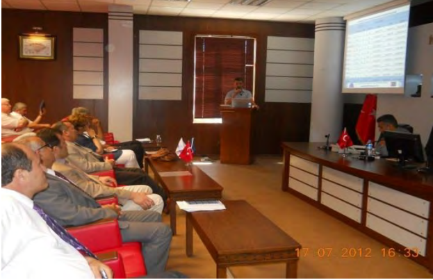
KAHRAMANMARAŞ 2012 YILI 2.UDYK TOPLANTISI