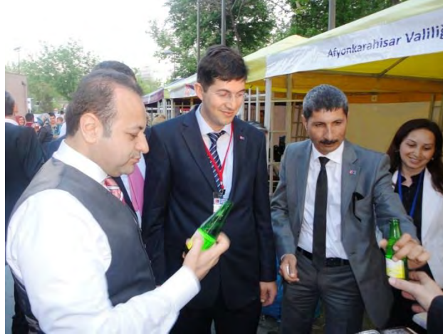
9 Mayıs Avrupa Günü etkinlikleri Afyonkarahisar Valiliği standı