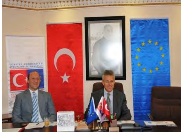
9 Mayıs Avrupa Günü