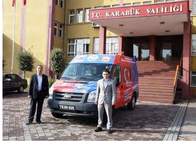
Karabük Valiliği AB Mobil Tanıtım Aracı