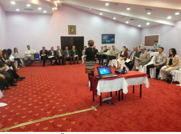
Hayat Boyu Öğrenme Bilgilendirme Toplantısı Amasya, 8 Eylül 2012