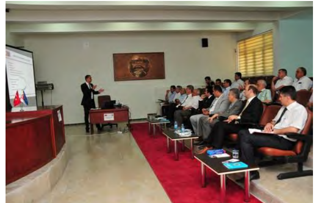
TUNCELİ AB UDYK 3.TOPLANTISI