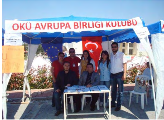
Bahar Şenliğinde Kurulan AB Stantı

Osmaniye Korkut Ata Üniversitesi Avrupa Birliği Kulübü ile Osmaniye Valiliği AB ve Proje Koordinasyon Bürosu işbirliğinde Üniversitenin 4. Bahar ve Spor Şenliklerinde Avrupa Birliği konusunda tanıtıcı etkinlikler yapılmıştır.