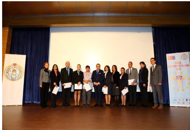
Muğla AB Yolunda Elele Projesi Sertifika Töreni

Avrupa Birliği Bakanlığı tarafından yürütülen İllerimiz AB'ye Hazırlanıyor II - AB Faaliyetlerine Destek Bileşeni altında desteklenen “Muğla AB Yolunda Elele” projesi kapsamında Muğla Valiliği AB ve Dış İlişkiler Koordinasyon Merkezi tarafından eğitimler, bilgilendirme toplantıları, çalışma ziyaretleri gerçekleştirilmiştir. Proje kapsamında www.muglaab.gov.tr isimli internet sitesi hizmete sunulmuştur.