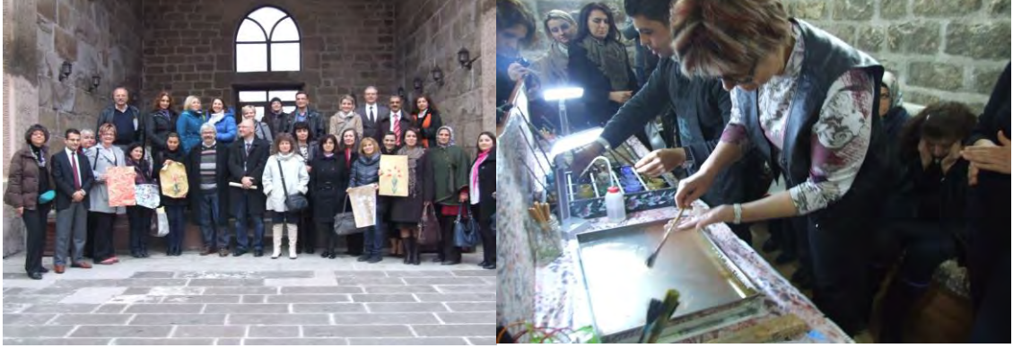
Mutlu Bir Yarın İçin Doğru Meslek Seçimi Projesi Ekibi

Hayatboyu Öğrenme Programı Leonardo da Vinci kapsamında yer alan proje, Aksaray Ticaret Meslek Lisesinin koordinatörlüğü ve Aksaray İl Milli Eğitim Müdürlüğü ile Aksaray Ticaret ve Sanayi Odasının yerel ortaklığında yürütülmüştür. Macaristan, Bulgaristan, Yunanistan, Romanya, Polonya, Fransa, İtalya ve Hırvatistan'ın proje ortağı olarak yer aldığı proje kapsamında, 14-18 yaş arası gençlerin meslek seçimine etki eden faktörlerin incelenmesi amaçlanmıştır. Çalışma toplantıları ile Aksaray ve Kapadokya bölgelerinde kültür gezileri düzenlenmiştir.