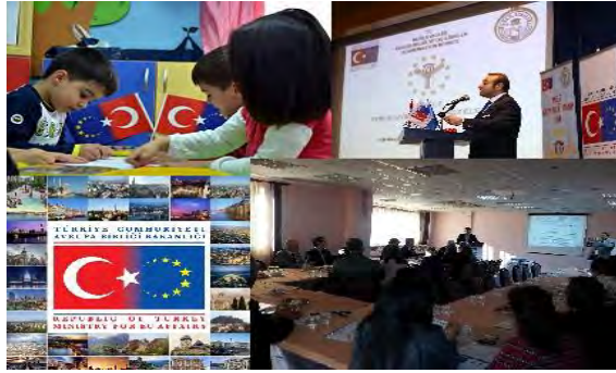
İllerimiz AB’ye Hazırlanıyor II Projesi