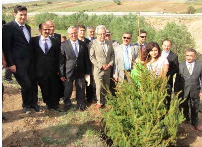
AB Hatıra Ormanı

“Afyonkarahisar Değerleriyle Avrupa Yolunda” projesi kapsamında, Avrupa Birliği Hatıra Ormanı’na 16 Mayıs 2012 tarihinde ilk fidan törenle dikilmiştir. Afyonkarahisar-Kütahya Karayolu üzerinde, Bayram Gazi Köyü yakınlarında oluşturulan hatıra ormanına fidan dikme törenine il müdürleri ve öğrenciler katılmıştır.