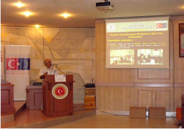
BALIKESİR AB UDYK 1.TOPLANTISI