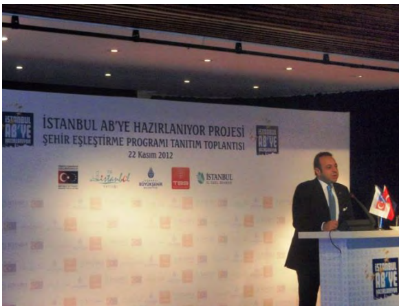
Şehir Eşleştirme Programı Tanıtım Toplantısı

Projenin bir diğer önemli faaliyeti olan Şehir Eşleştirme Programı kapsamında İstanbul ilçelerine yönelik yapılan teklif çağrısı sonucunda Bağcılar, Beylikdüzü, Beyoğlu, Gaziosmanpaşa, Güngören Maltepe, Sarıyer, Sultanbeyli, Şile ve Ümraniye pilot ilçeler olarak belirlenmiştir. AB üye ülkeleri yerel yönetimlerine yönelik teklif çağrısı sonucu seçilecek AB yerel yönetimleri ile İstanbul'daki 10 pilot ilçe 22-24 Mayıs 2013 tarihleri arasında düzenlenecek Şehir Eşleştirme Çalıştayı'nda biraraya geleceklerdir. Çalıştay sonucunda birbirleriyle eşleşecek yerel yönetimler karşılıklı ziyaretler sonucunda AB mevzuatının yereldeki uygulamalarına yönelik ortak projeler ve faaliyetler geliştireceklerdir.