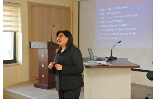
SAMSUN 2012 YILI 2.UDYK TOPLANTISI