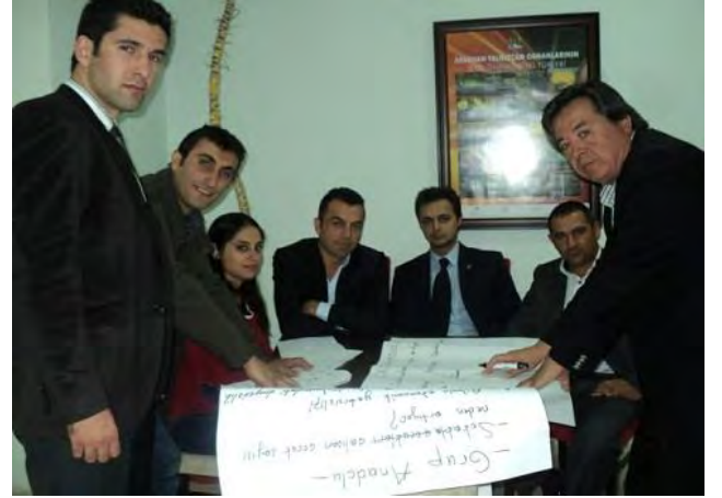
Proje Döngüsü ve Yönetimi Eğitimi Ardahan, 3-5 Ekim 2012