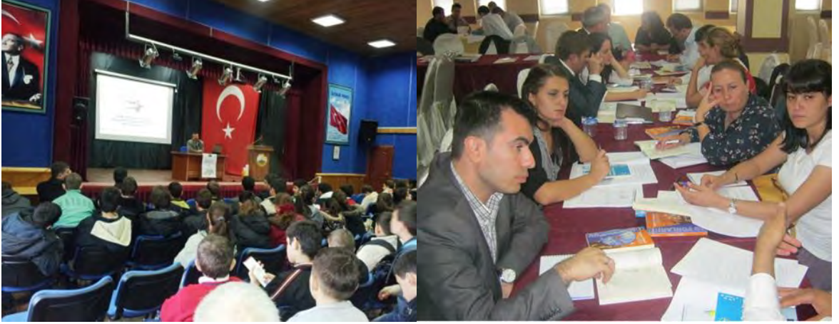
Sakarya AB Yolunda” Projesi Etkinlikleri

Avrupa Birliği Bakanlığı'nın İllerimiz AB'ye Hazırlanıyor Programı II-AB Faaliyetlerine Destek Bileşeni kapsamında desteklenen “Sakarya AB Yolunda” projesi, Sakarya Valiliği'nin de eşfinansman katkısı ile birçok eğitim faaliyetinin gerçekleşmesine imkan tanımıştır. Bunlar arasında “Proje Döngüsü Yönetimi Eğitimi”, “Eğiticilerin Eğitimi” ve 25 okulda 1250 öğrenciye yönelik gerçekleştirilen “Temel AB Eğitimi” yer almaktadır. Eğitimlerin yanında, Kocaeli Valiliği'ne yapılan çalışma ziyareti, Valilik AB Birimi logosu tasarım yarışması, kamuoyu ile iletişim amacıyla görsel materyaller hazırlanması gibi etkinliklerle AB biriminin kapasitesinin ve kamuoyundaki AB farkındalığının artırılması amaçlanmıştır.