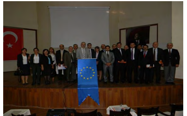
ZONGULDAK 2012 YILI 2.UDYK TOPLANTISI