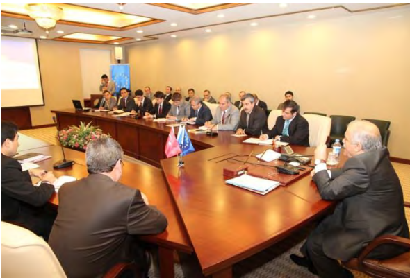
YOZGAT 2012 YILI 4.UDYK TOPLANTISI