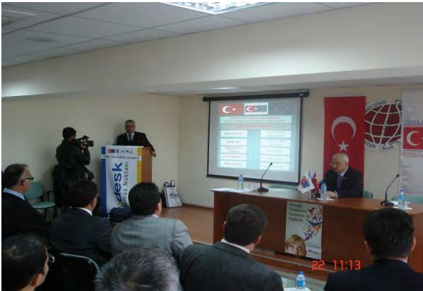
NİĞDE AB UDYK 3.TOPLANTISI