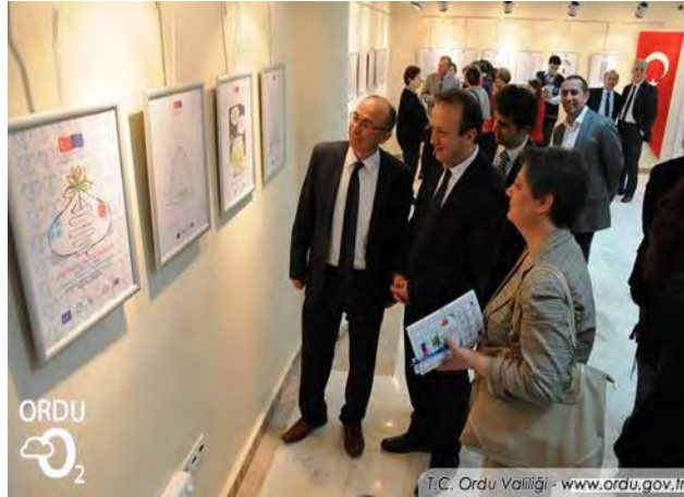
"Karikatürlerle Türk-Yunan Dostluđu Projesi" Karikatür Sergisi

Nezih Danyal Karikatür Vakfı ve Yunanistan Karikatür Dostları Derneđi'nin "Türkiye ve AB Sivil Toplum Diyalogu-II Kültür, Sanat Bileřeni Hibe Programı" kapsamında düzenlediđi çalıřtaylar sonucunda çizilen karikatürlerden oluřan 'Karikatürlerle Türk-Yunan Komřuluđu' konulu karikatür sergisi 6 Nisan 2012 tarihinde sergilenmiřtir.