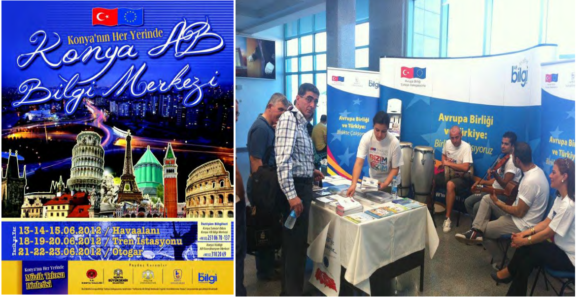
Konya'nın Her Yerinde AB Bilgi Merkezi Etkinliği

Üniversitesi Devlet Konservatuvarı müzik bölümü son sınıf öğrencileri tarafından doğu-batı müziği sentezi sunulmuştur.