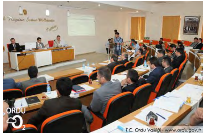
ORDU AB UDYK 2.TOPLANTISI