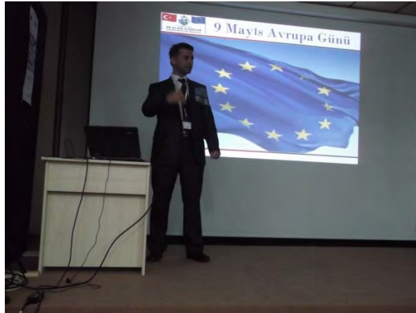
9 Mayıs Avrupa G¼n¼ Etkinliđi

Giresun niversitesi ile Eynesil, G¼rele ve Tirebolu Meslek Y¼ksekokulları'nda "Eurodesk" ve "Gençler için Avrupa" fırsatları konulu seminerler d¼zenlenmiœtir.