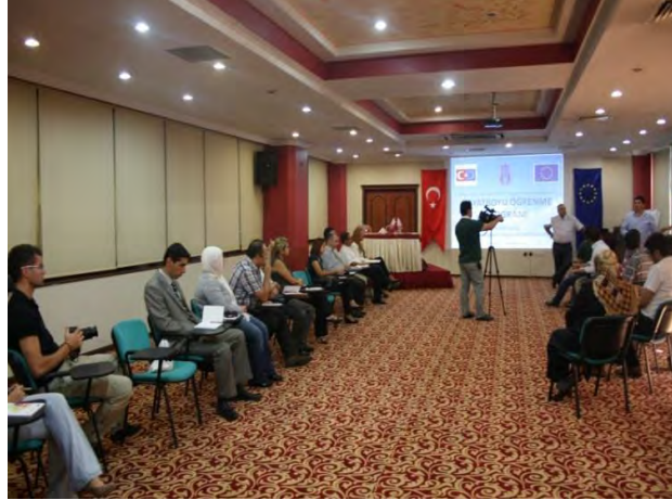
24 Eylül 2012 Tarihli Hayatboyu Öğrenme ve Gençlik Programları Bilgi Günü

“Leonardo da Vinci” ve alt bileşenleri konusunda yapılan bilgilendirmeler sonrasında katılımcılar kendi seçtikleri çalışma gruplarına ayrılmışlardır. Çalışmalar gruplarda devam etmiştir.