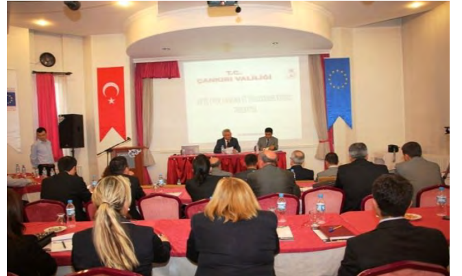
ÇANKIRI 2012 YILI 2.UDYK TOPLANTISI