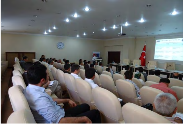
BİNGÖL AB UDYK 2.TOPLANTISI