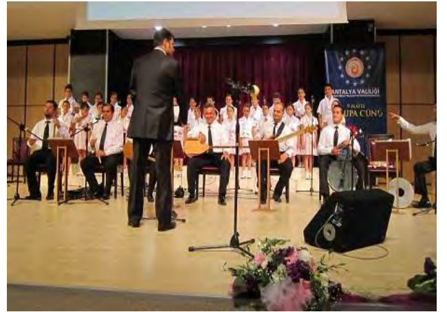
9 Mayıs Avrupa Günü Etkinlikleri