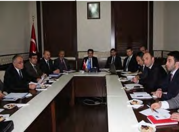
Güncel Hibe Duyuruları Bilgilendirme Toplantısı Bayburt, 21 Aralık 2012