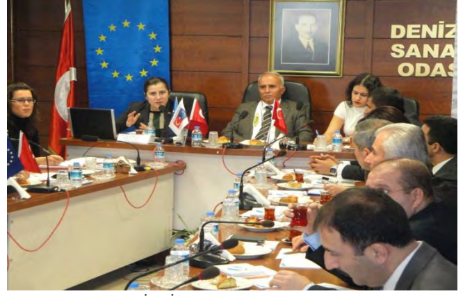
DENİZLİ AB UDYK 4. TOPLANTISI