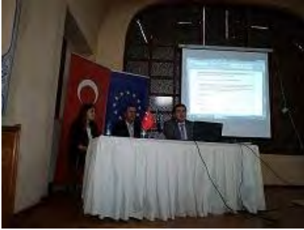
Gençlik programları Bilgilendirme Toplantısı Edirne, 26 Mart 2012