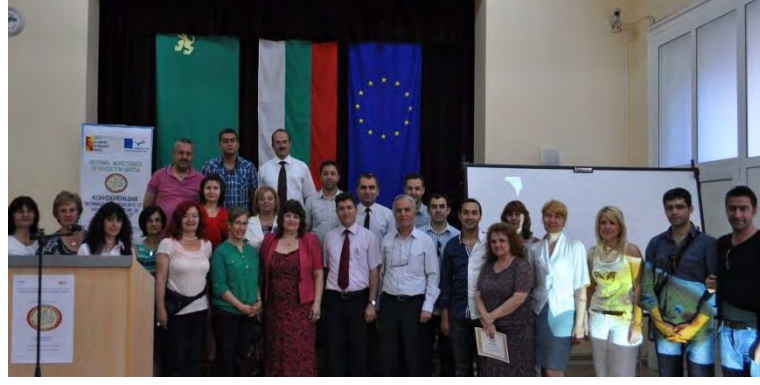
İlköğretim Çağındaki Öğrencilerin Okuma Motivasyonlarının Artırılması Projesi

Hayatboyu Öğrenme Programı Comenius Bölgesel Ortaklıklar kapsamında Erzincan İl Milli Eğitim Müdürlüğü ve Bulgaristan-Vratsa Bölgesel Eğitim Müdürlüğü ortaklığında uygulanan proje ile daha nitelikli eğitim yapılandırması için proje ortakları arasında iyi örneklerin sergilenmesi ve geliştirilmesi faaliyetleri gerçekleştirilmiştir.