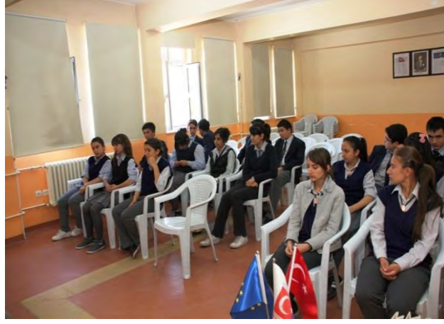
9 Mayıs Avrupa Günü Etkinlikleri