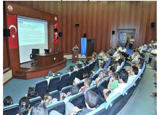
AB Hibeleri Eğitimi 2012, Osmaniye