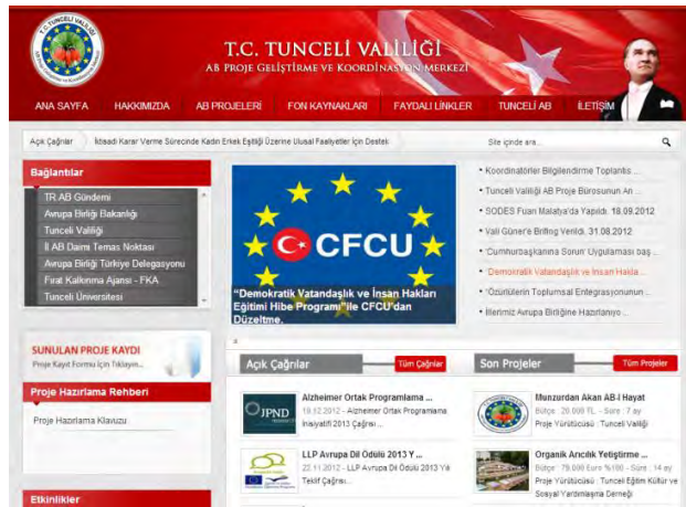
Tunceli Valiliği AB Proje Geliştirme ve Koordinasyon Merkezi İnternet Sitesi

“Munzurdan Akan AB-I Hayat” projesi kapsamında Tunceli Valiliği AB Koordinasyon Merkezi internet sitesi hayata geçmiştir. Tunceli ilinde yapılan AB ile ilgili tüm çalışmalara internet sitesinde yer verilmektedir.