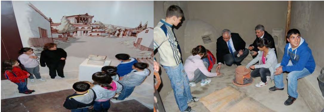
Çorum Müzesi'nde Bir Şeyler Oluyor Projesi Etkinlikleri

Çorum Müze Müdürlüğü koordinasyonunda ve Alman Madencilik Müzesi-(German Bergbau Museum / Bochum), Çorum İl Özel İdaresi, Çorum İl Milli Eğitim Müdürlüğü ve Çorum Gazeteciler Cemiyeti işbirliği içerisinde "Sivil Toplum Hizmeti: AB-Türkiye Kültürlerarası Diyalog Müzeler Bileşeni" kapsamında yürütülen proje ile kültürlerarası diyalogun artırılması, AB ve Türkiye arasında karşılıklı anlayışın ve sivil toplum diyalogunun geliştirilmesi ve bu sayede üyelik sürecine katkı sağlanması hedeflenmiştir. Proje kapsamında eğitimler, resim ve kompozisyon yarışmaları ile Almanya, Çorum, Tokat ve Samsun'a çalışma ziyaretleri gerçekleştirilmiştir.