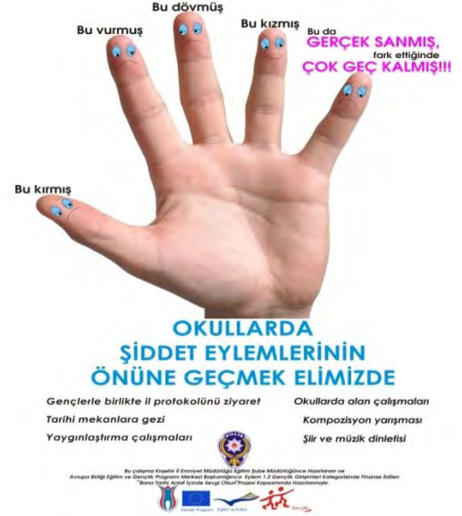
Bana Tarihi Anlat İçinde Sevgi Olsun Proje Ekibi