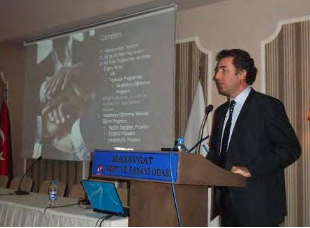
AB Mali Kaynakları, Hibe Programları, Hayatboyu Öğrenme ve Gençlik Programları Eğitimi Antalya, 14 Şubat 2012