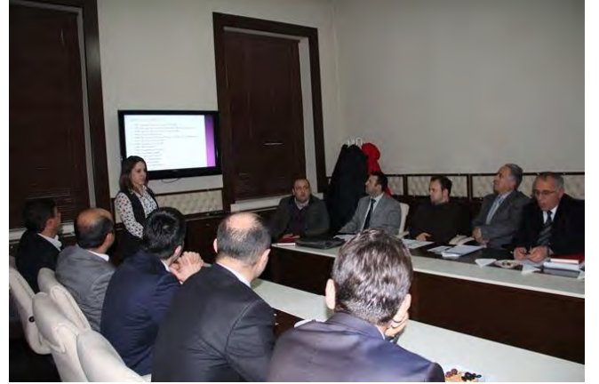
BAYBURT AB UDYK 1. TOPLANTISI