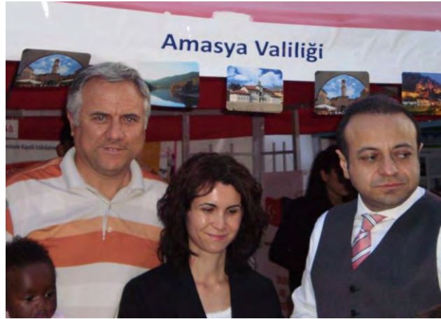
9 Mayıs Avrupa Günü Etkinlikleri Amasya Valiliği Standı

AB Bakanlığı ile Ankara Büyükşehir Belediyesi'nin himayelerinde ve AB Türkiye Delegasyonunun da katılımı ile Ankara Gençlik Parkı'nda düzenlenen Avrupa Günü Şenliği'ne katılım sağlanmıştır.