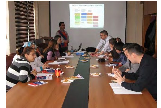
Proje Döngüsü Yönetimi Eğitimi Bingöl, 9-12 Ocak 2012