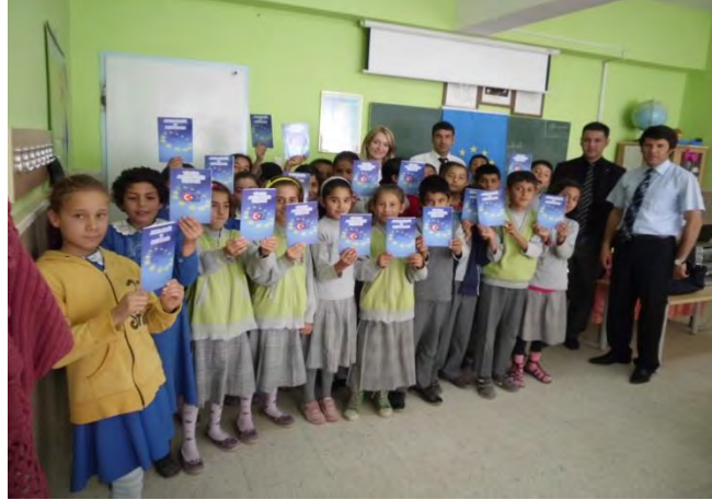
Kilis Valiliği 9 Mayıs Etkinlikleri

7 Aralık Üniversitesi'nde kurulan stantta ve ilköğretim okullarında AB hakkında dökümanlar dağıtılmış, bilgilendirme yapılmıştır.