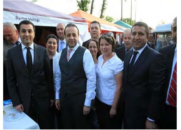
9 Mayıs Avrupa Günü Etkinlikleri Bartın il standı