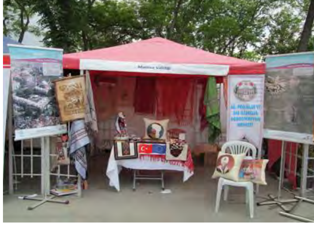
Manisa Valiliği'nin 9 Mayıs Avrupa Günü için Ankara Gençlik Parkında açtığı stant

AB Bakanlığı ile Ankara Büyükşehir Belediyesi'nin himayelerinde ve AB Türkiye Delegasyonunun da katılımı ile Ankara Gençlik Parkı'nda düzenlenen Avrupa Günü Şenliği'ne katılım sağlanmıştır.