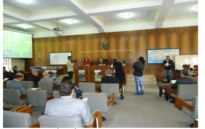
ESKİŞEHİR AB UDYK 2.TOPLANTISI