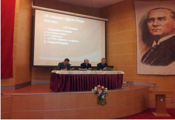
SAKARYA 2012 YILI 4.UDYK TOPLANTISI