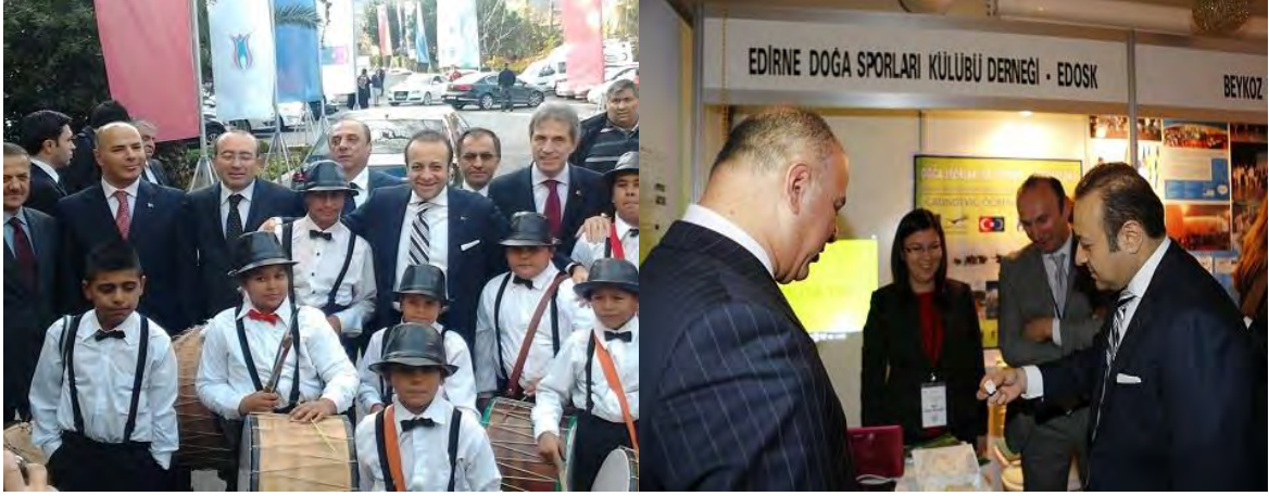
İstanbul Bölgesel Proje Fuarı Edirne İli standı