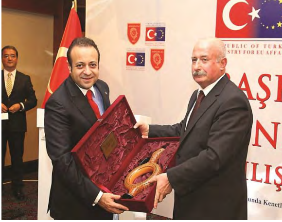
Ankara AB'ye Hazırlanıyor Projesi Açılış Töreni