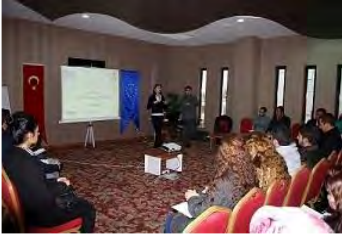
Ulusal Ajans Bilgilendirme Toplantısı 23 Kasım, Karaman