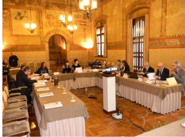
Kentlerde Güvenlik ve Kriz Yönetimi

Konak Kaymakamlığı'nın İtalya, Romanya, ve İngiltere'den ortaklar ile yürüttüğü “Leonardo da Vinci Development of Innovation Multilateral” projesi ile; büyükşehirlerde kamu güvenliği ve kriz yönetimi üzerine araştırmalar yapılarak kentsel alanların nasıl daha güvenli ve emniyetli hale gelebileceğinin ve bu alanda çalışacak kişilerin hangi vasıflara ve ne tür eğitimlere ihtiyaç duyduklarının araştırılması, kriz yönetimi alanında akademik bir eğitime dönüşecek yeni bir modül oluşturulması amaçlanmaktadır. 529.823 Avro bütçesi olan projenin uygulama süresi 2 yıldır.