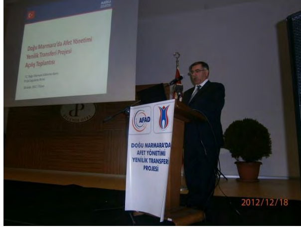
Doğu Marmara'da Afet Yönetimi Projesi Açılış Toplantısı, 18 Aralık 2012

Afet ve Acil Durum Müdürlüğü başvuru sahibi, Doğu Marmara Kalkınma Ajansı ise koordinatör ortaktır. Projede Doğu Marmara Bölgesi'nde yer alan tüm illerin Afet ve Acil Durum Müdürlükleri, AKUT Derneği, Bolu Abant İzzet Baysal Üniversitesi, Avusturya'dan Salzburg Üniversitesi, İtalya'dan Foligno Merkezi Araştırmalar Enstitüsü ortak olarak yer almaktadır. Bütçesi 248.759 Avro olan proje kapsamında gerçekleştirilecek modelleme eğitimleri esnasında muhtemel afetlerin etkileri bilgisayar ortamında görülecektir. Yurt dışında uygulanan ve proje kapsamında transfer edilen proje detaylarına http://cast.sbg.ac.at/ adresinden ulaşılabilir. Avrupa'da 13 ortaklı olarak gerçekleştirilen bu projede Avrupa'daki 27 ülkede afet yönetiminde koordinasyon amaçlanmıştır.