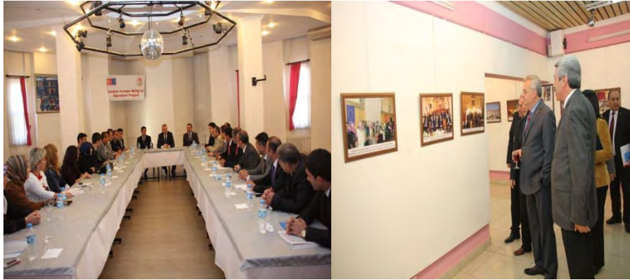
AB Mali Yardımları Eğitimi

Avrupa Birliği Bakanlığı tarafından yürütülen İllerimiz AB'ye Hazırlanıyor II-AB Faaliyetlerine Destek Bileşeni altında desteklenen “Çankırı AB'yi Öğreniyor Projesi” kapsamında Çankırı Valiliği Dış İlişkiler ve Projeler Koordinasyon Merkezi tarafından AB mali yardımları eğitimi, Avrupa Birliği ile Müzakere Süreci Konferansı bilgilendirme toplantıları, gençlere yönelik kompozisyon yarışması ve fotoğraf sergisi gerçekleştirilmiştir.