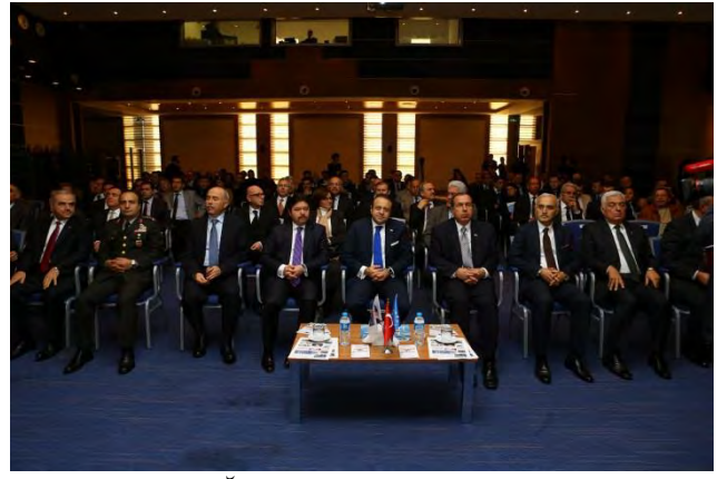
MUĞLA AB UDYK 2. TOPLANTISI