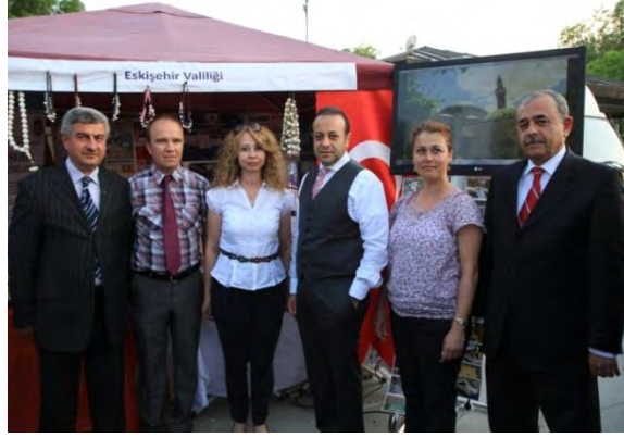
9 Mayıs Avrupa G¼n¼ Etkinliđi Eskiœehir Valiliđi Standı

AB Bakanlıđı ile Ankara B¼y¼kœehir Belediyesi'nin himayelerinde ve AB T¼rkiye Delegasyonunun da katılımı ile Ankara Gençlik Parkı'nda d¼zenlenen Avrupa G¼n¼ œenliđi'ne katılım sađlanmıœtır. Eskiœehir Valiliđi adına AB Proje Geliœtirme ve Koordinasyon Merkezi tarafından stant açılarak, yapılan projeler ile Eskiœehir ilinin tarihi ve k¼lt¼rel deđerleri tanıtılmıœtır.