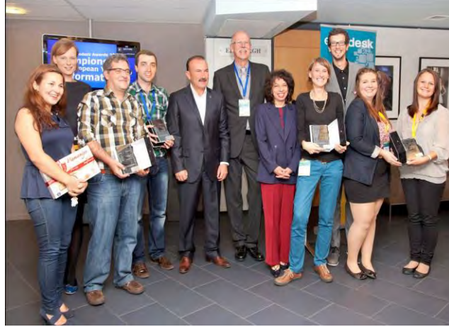
Ödül töreninden bir kare

İzmit Belediyesi Gençlik Bilgi ve Danışma Merkezi (Genç-İz) Avrupa genelinde “Eurodesk 2012 Yılı Gönüllü Kazandırma Şampiyonu” olmuş ve 27 Eylül 2012 tarihinde Brüksel’de gerçekleşen törende ödül almaya hak kazanmıştır.