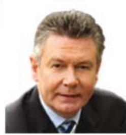
Karel De Gucht (Belçika) Ticaretten Sorumlu Avrupa Komisyonu Üyesi

Web: http://ec.europa.eu/commission_2010-2014/barnier/contact/commissioner/index_en.htm