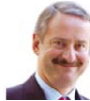
Siim Kallas (Estonya) Taşımacılıktan Sorumlu Avrupa Komisyonu Üyesi (Avrupa Komisyonu Başkan Yardımcısı)

Web: http://ec.europa.eu/commission_2010-2014/almunia/contact/commissioner/index_en.htm