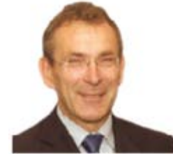
Andris Piebalgs (Litvanya) Kalkınmadan Sorumlu Avrupa Komisyonu Üyesi

Web: http://ec.europa.eu/commission_2010-2014/sefcovic/contact/commissioner/index_en.htm