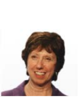
Catherine Ashton (Birleşik Krallık) Birlik Dış ve Güvenlik Politikası Yüksek Temsilcisi (Avrupa Komisyonu Başkan Yardımcısı)

Web: ec.europa.eu/commission_2010-2014/reding/contact/index_en.htm#post