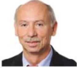
Januzs Lewandowski (Polonya) Mali Programlama ve Bütçeden Sorumlu Avrupa Komisyonu Üyesi

Web: http://ec.europa.eu/ commission_2010-2014/ lewandowski/contact/ commissioner/index_en.htm