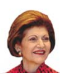
Androulla Vassiliou (Güney Kıbrıs Rum Yönetimi) Eğitim, Kültür, Çok Dillilik ve Gençlikten Sorumlu Avrupa Komisyonu Üyesi

Web: http://ec.europa.eu/commission_2010-2014/degucht/contact/