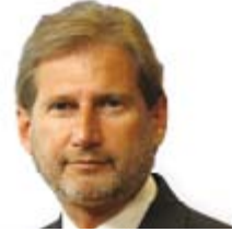
Johannes Hahn (Avusturya) Bölgesel Politikadan Sorumlu Avrupa Komisyonu Üyesi

Web: http://ec.europa.eu/ commission_2010-2014/ damanaki/contact/ commissioner/index_en.htm