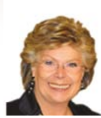
Viviane Reding (Lüksemburg) Adalet, Temel Haklar ve Vatandaşlıktan Sorumlu Avrupa Komisyonu Üyesi (Avrupa Komisyonu Başkan Yardımcısı)

Web: http://ec.europa.eu/commission_2010-2014/president/contact/mail/index_en.htm