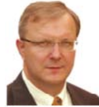
Olli Rehn (Finlandiya) Ekonomi ve Parasal İşlerden Sorumlu Avrupa Komisyonu Üyesi

Web: http://ec.europa.eu/commission_2010-2014/tajani/contact/commissioner/index_en.htm