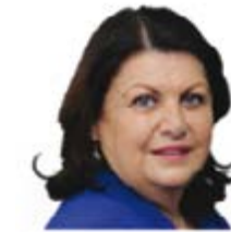
Máire Geoghegan-Quinn (İrlanda Cumhuriyeti) Araştırma ve Yenilikçilikten Sorumlu Avrupa Komisyonu Üyesi

Web: http://ec.europa.eu/commission_2010-2014/semeta/contact/commissioner/index_en.htm