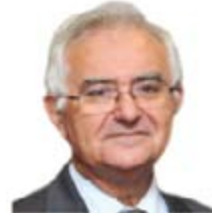
John Dalli (Malta) Sağlık ve Tüketici Politikasında Sorumlu Avrupa Komisyonu Üyesi

Web: http://ec.europa.eu/commission_2010-2014/vassiliou/contact/commissioner/index_en.htm