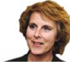
Connie Hedegaard (Danimarka) İklimden Sorumlu Avrupa Komisyonu Üyesi

Web : http://ec.europa.eu/ commission_2010-2014/ georgieva/contact/ commissioner/index_en.htm