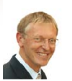
Janez Potocnik (Slovenya) Çevreden Sorumlu Avrupa Komisyonu Üyesi

Web: http://ec.europa.eu/commission_2010-2014/kroes/