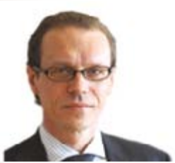
Algirdas Šemeta (Letonya) Vergilendirme ve Gümrük Birliği, Denetim ve Sahtecilikle Mücadeleden Sorumlu Avrupa Komisyonu Üyesi

Web: http://ec.europa.eu/commission_2010-2014/dalli/contact_en.htm