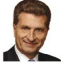
Günter Oettinger (Almanya) Enerjiden Sorumlu Avrupa Komisyonu Üyesi

Web: http://ec.europa.eu/ commission_2010-2014/ lewandowski/contact/ commissioner/index_en.htm