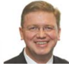
Štefan Füle (Çek Cumhuriyeti) Genişleme ve Komşuluk Politikasında Sorumlu Avrupa Komisyonu Üyesi

Web: http://ec.europa.eu/ commission_2010-2014/ hedegaard/contact/ commissioner_en.htm