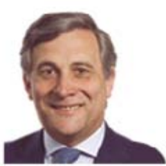
Antonio Tajani (İtalya) Sanayi ve Girişimcilikten Sorumlu Avrupa Komisyonu Üyesi (Avrupa Komisyonu Başkan Yardımcısı)

Web: http://ec.europa.eu/commission_2010-2014/potocnik/contact_en.htm