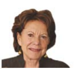
Neelie Kroes (Hollanda) Dijital Gündemden Sorumlu Avrupa Komisyonu Üyesi (Avrupa Komisyonu Başkan Yardımcısı)

Web: http://ec.europa.eu/commission_2010-2014/kroes/