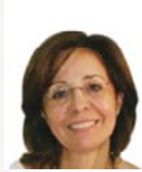
Maria Damanaki (Yunanistan) Balıkçılık ve Denizcilik İşlerinden Sorumlu Avrupa Komisyonu Üyesi

Web: http://ec.europa.eu/ commission_2010-2014/ oettinger/contact/ commissioner/index_en.htm