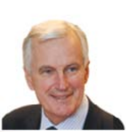
Michel Barnier (Fransa) İç Pazar ve Hizmetlerden Sorumlu Avrupa Komisyonu Üyesi

Web: http://ec.europa.eu/commission_2010-2014/barnier/contact/commissioner/index_en.htm