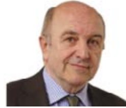
Joaquin Almunia (İspanya) Rekabetten Sorumlu Avrupa Komisyonu Üyesi (Avrupa Komisyonu Başkan Yardımcısı)

Web: http://www.eeas.europa.eu/ashton/spokespersons/index_en.htm