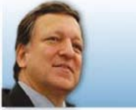
José Manuel Barroso (Portekiz) Avrupa Komisyonu Başkanı

Web: http://ec.europa.eu/commission_2010-2014/president/contact/mail/index_en.htm