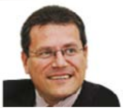
Maroš Šefčovič (Slovakya) Kurumlararası İlişkiler ve İdari İşlerden Sorumlu Avrupa Komisyonu Üyesi (Avrupa Komisyonu Başkan Yardımcısı)

Web: http://ec.europa.eu/commission_2010-2014/rehn/contact/commissioner/index_en.htm