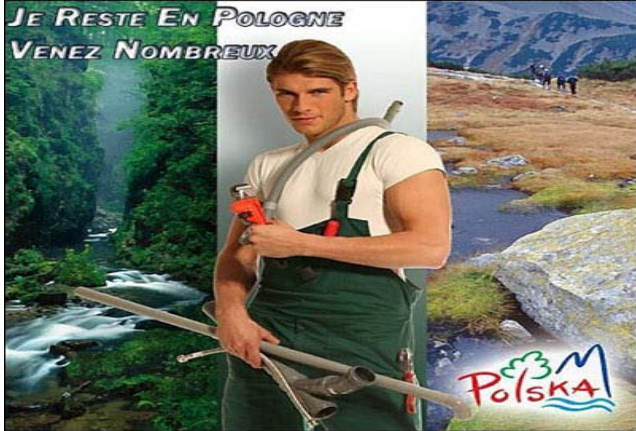
"I'm staying in Poland, come one and all", Polish Tourist Board