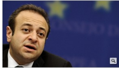
Egemen Bağış, 42, ist der erste Europaminister der Türkei. Der Abgeordnete der islamisch-konservativen Demokratischen Partei AKP ist als Reformler und entschiedener

Die Religionsfreiheit ist durch eine Reihe von Gesetzen und internationalen Konventionen fest verankert. Auch in Deutschland garantiert das Grundgesetz im Artikel 4 dieses Recht. Das dachte man zumindest. Die Türkei beobachtet mit Verwunderung, dass die ungestörte Religionsausübung in Deutschland nicht mehr vorbehaltlos gewährleistet ist. Seit das Kölner Landgericht im Juni die Beschneidung von Jungen aus religiösen Gründen zur strafbaren, rechtswidrigen Körperverletzung erklärt hat, kommen Zweifel an der Aufrichtigkeit der Religionsfreiheit in der gelebten Praxis auf.